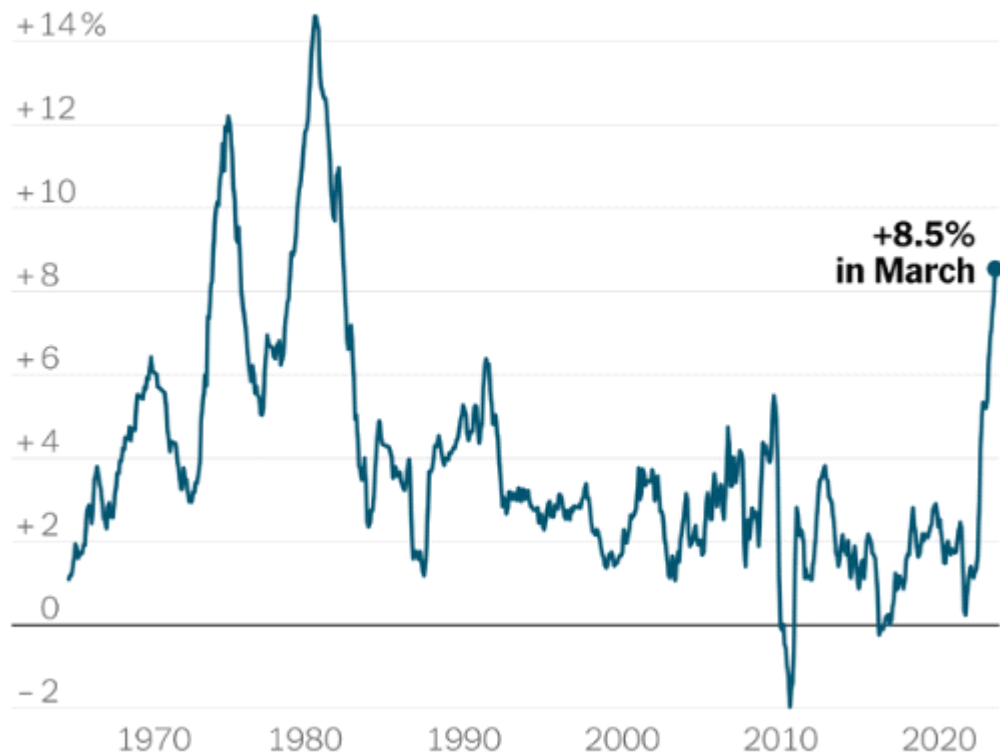
Chart shows year-over-year percent change.